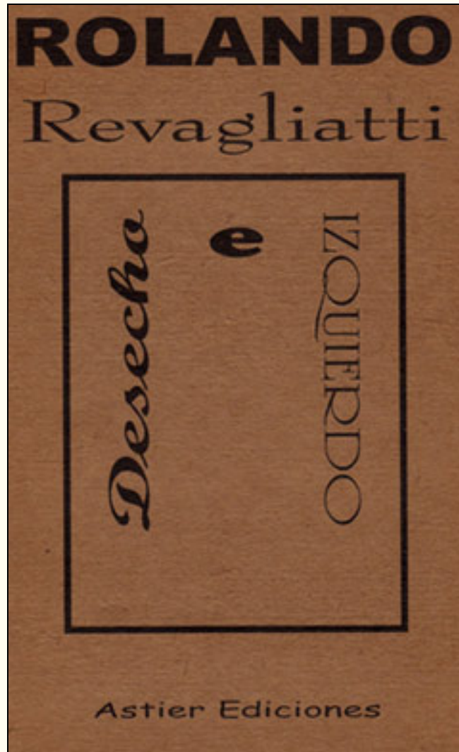
Tapa de la edición impresa